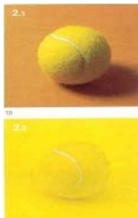
شکل ۱۳- وجود کنتراست کافی

برای تشخیص یک شیء باید درخشندگی شیء و محیط پیرامون آن متفاوت باشد. این تفاوت معمولاً ناشی از کنتراست رنگ و کنتراست درخشندگی به طور هم‌زمان است. شکل ۱۳ این نکته را به وضوح نمایان می‌کند.