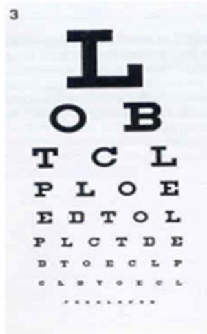
شکل ۱۴- اندازه مناسب

اندازه اشیاء باید به گونه‌ای باشد که بتوان آنها را به وضوح دید. بنابراین هرچه شیء بزرگتر باشد، دیدن آن آسان‌تر است. شکل ۱۴ این نکته را نشان می‌دهد.