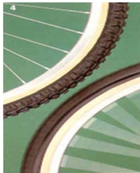
شکل ۱۵- داشتن زمان کافی برای دیدن

عمل تشخیص نیاز به زمان کافی دارد. به عنوان مثال: جزئیات یک چرخ در حال حرکت با سرعت آرام قابل مشاهده است ولی چنانچه این چرخ با سرعت زیاد حرکت کند، جزئیات آن قابل تشخیص نمی‌باشد. شکل ۱۵ حرکت آرام و سریع چرخ را نشان می‌دهد.